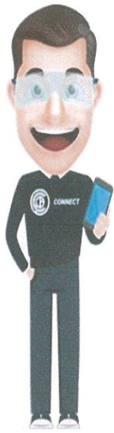
คุยกับพีปกป้อง Chatbot พร้อมให้บริการ

ทั้งนี้ ยังมี “พีปกป้อง” เป็น chatbot ที่ สคบ.ได้พัฒนาขึ้นมา เพื่อเป็นผู้ช่วยให้คำปรึกษาผู้บริโภค สามารถคอยสอบถามเรื่องด้านธุรกิจ ออกกำลังกาย, ด้านธุรกิจสายการบิน, ด้านธุรกิจโทรศัพท์เคลื่อนที่, ด้านธุรกิจให้เช่าซื้อรถยนต์, ธุรกิจการให้กู้ยืมเงิน, ช่องทางร้องเรียน, ความหมายและติดต่อหน่วยงาน, ด้านฉลาก, ด้านโฆษณา, ด้านหมู่บ้านจัดสรร, ด้านธุรกิจประกันภัย, ด้านธุรกิจบัตรเครดิต, ด้านธุรกิจขายอาหารชุด, ด้านธุรกิจการให้เช่าที่อยู่อาศัย